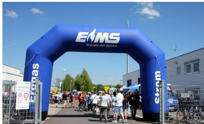
Bild vom 2. Salzlandradeltag 2016 bei ems in Brumby (A. Hennecke)

Von 11.00 Uhr bis 12.00 Uhr treffen die Sternfahrten aus vielen Orten des Salzlandkreises am Concordia Sees in Schadeleben ein.