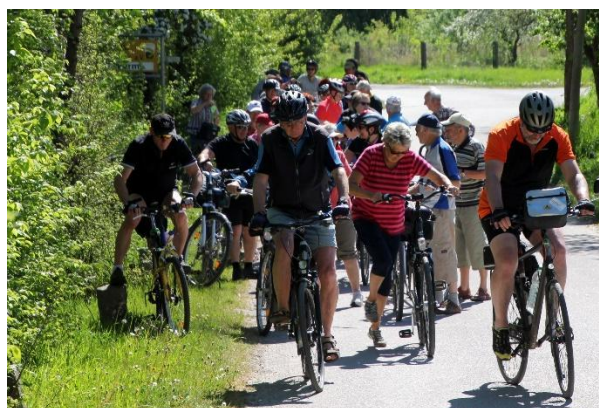
Bild einer Radtour von Bernburg zum Salzlandradeltag

Traditionell führen Rad-Touren unter Anleitung erfahrener Tourenleiter von Orten des Salzlandkreises in einer Sternfahrt auf das Gelände der Radlerparty. In diesem Jahr starten 15 Touren, davon 2 aus Aschersleben und je eine aus Atzendorf, Bernburg, der Gemeinde Bördeland, Calbe, aus der Egelner Mulde, Förderstedt, Glöthe, Harzkreis, Ilberstedt, Nienburg (Saale), Seeland und Staßfurt. Die Schönebecker Radler fahren privat zur Seepromenade am Concordia See und nehmen dort an der Seeland-Tour teil. Alle Interessenten können sich einer Tour anschließen oder privat nach