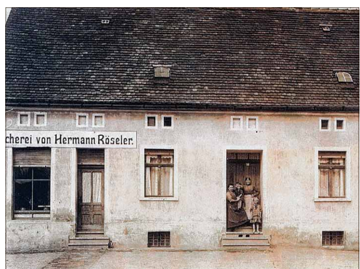
Vor dem Gebäude platzierte der Fotograf ein paar Menschen, die anscheinend dort wohnten.