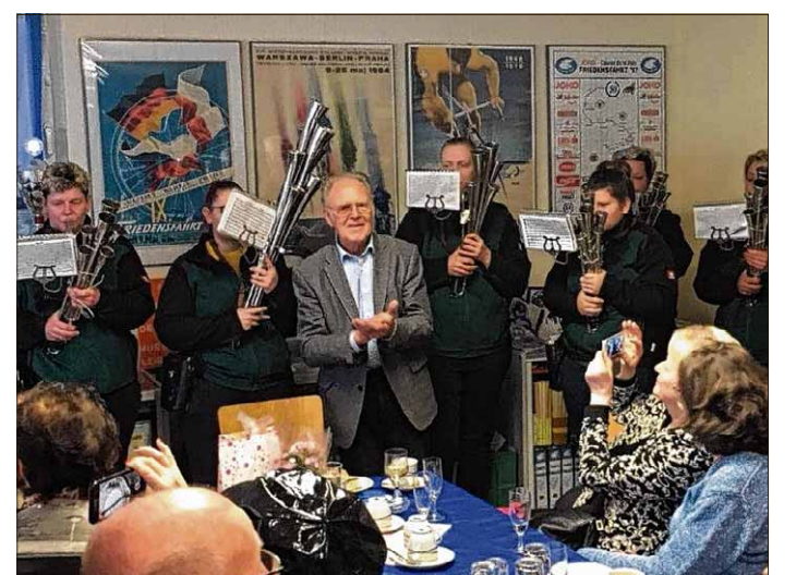
Täve Schur erhält an seinem 89. Geburtstag ein Ständchen vom Kleinmühlhager Schalmeiorchester.

Im nächsten Jahr soll dann der 90. Geburtstag von Täve Schur ebenfalls in Kleinmühlhagen gefeiert werden.